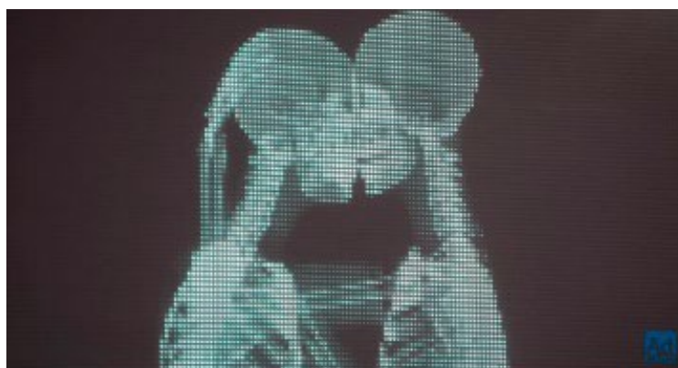
Love Has No Labels | Diversity & Inclusion | Ad Council

https://www.youtube.com/watch?v=PnDgZuGihHs