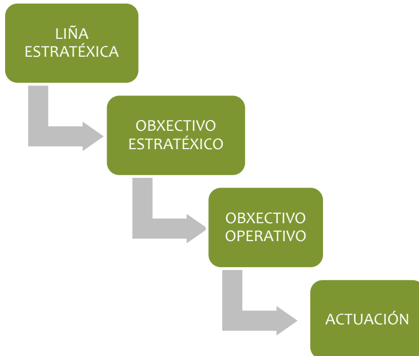
FIGURA 3: ESTRATEXIA GALEGA PARA A INFANCIA E ADOLESCENCIA 2016-2020. ESTRUTURA BASE

A estrutura descrita responde á análise da situación de partida, así como das fortalezas e dos aspectos de mellora dos programas e recursos vixentes dirixidos especificamente á infancia e adolescencia. Responde tamén, moi especialmente, á pretensión da EGIA de ser unha iniciativa marco do Goberno galego orientada a unir esforzos e aproveitar as sinerxías para que as necesidades, os intereses, as inxedanzas e a situación en xeral da poboación infantil e adolescente de Galicia se aborde dun xeito integral e con carácter transversal no conxunto da Administración Xeral da Comunidade Autónoma.